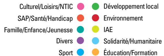
Thématiques d'accompagnement des structures en PACA (données Enée 2012)